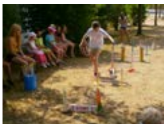
Kanin-Hop beim Ferienprogramm

Veranstaltungstipp: Montag, 14. August 2017 Ferienprogramm mit Hobbykaninchenmeisterschaft