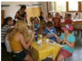
Ferienprogramm: Bau von Hürden für Kanin-Hop

Bereits seit über 25 Jahren wird diese Sportart in den skandinavischen Ländern durchgeführt. Jetzt auch in Berching!