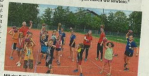
Mit der DJK Neumarkt wurde Handball gespielt.